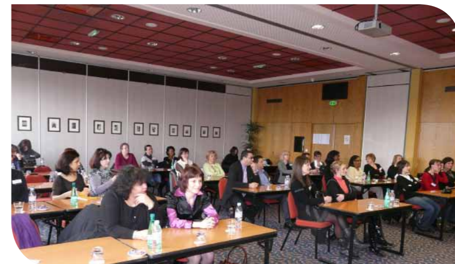
Journées Métiers : Hôtesse d'Accueil

Dans le cadre de la démarche Talents et Diversité, un groupe de travail mixte, composé majoritairement de cadres dirigeants, a mené une réflexion pour promouvoir l'équilibre des femmes et des hommes aux différents niveaux de responsabilité au sein de Batigère, Cilgère, Logéhab et Quadral.