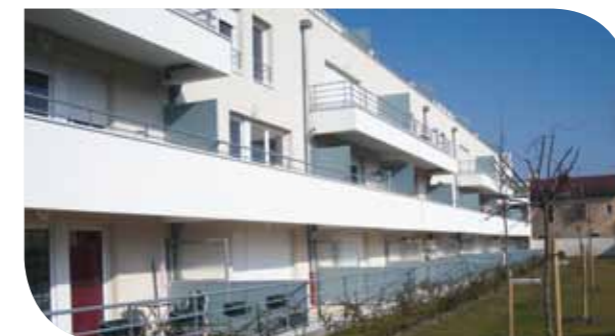
Chalon-sur-Saône Général Giraud - Neuf Collectif

A cet effet, le développement d'une activité immobilière sur Dijon s'organise par la constitution de QUATRIAL, G.I.E. regroupant Logivie, Orvitis, Logéhab et Bourgogne Habitat.