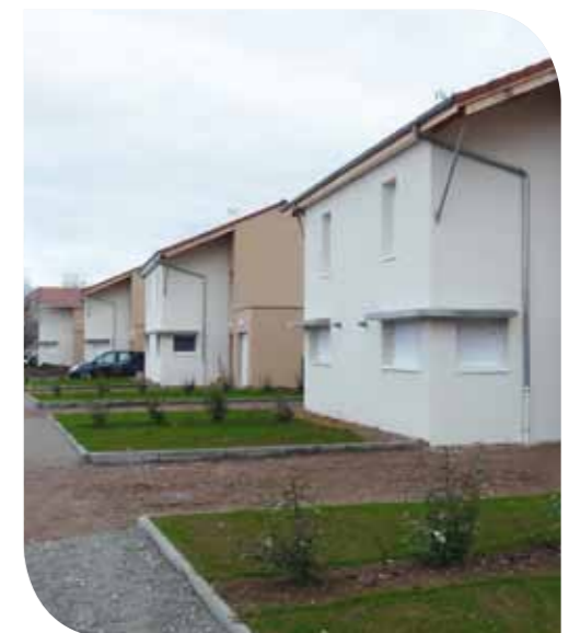
Varennes-Vauzelles Louise de Vilmorin - Neuf individuel