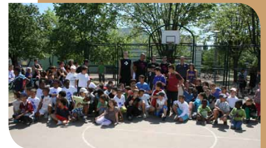
Challenge Basket de Rue

Le challenge C'est la marque de fabrique connue et reconnue par tous. En juin 2010, l'animation du basket de rue, gratuite et ouverte à tous, a réuni à Chalon-sur-Saône plus d'une centaine de garçons et de filles entraînés et coachés par les pros de l'équipe favorite des Chalonnais. Logivie, Entreprise Sociale pour l'Habitat, a à cœur d'offrir à ses habitants tout le confort de vie nécessaire à leur bien être, dépassant les frontières de leur logement. Ainsi cette démarche a pour but d'apporter plus de convivialité, d'intégration et d'implication de tous : habitants, jeunes, associations, écoles, collectivités locales... Pour Logivie, le Challenge Basket est bien plus qu'une action sportive, c'est un réel outil d'intégration et d'implication pour tous. Batigère