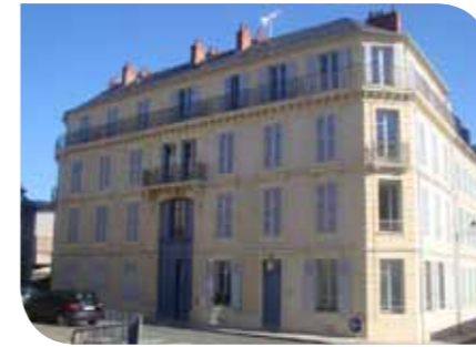
Nevers - Jean Desveaux - Acquisition/amélioration

Les études pour démolition de 5 sites en Saône-et-Loire devenus obsolètes et sans demandes locatives à venir ont également été engagées (155 logements).