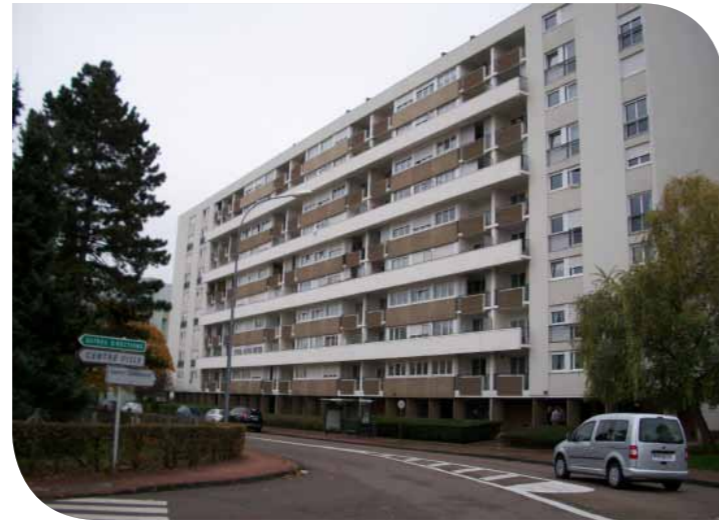
Chalon-sur-Saône - Bossuet - Réhabilitation