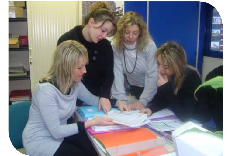
Tous impliqués pour la satisfaction Client

attentes traitées : (1 000 par rapport à 2009) 90 % d'attentes techniques 10 % d'attentes commerciales