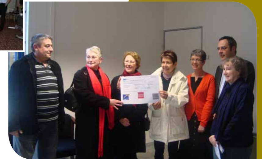
Remise de chèque de la Fondation au Centre Social de Fourchambault