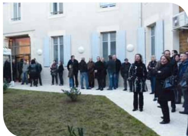
Inauguration Desveaux - 26 octobre 2010