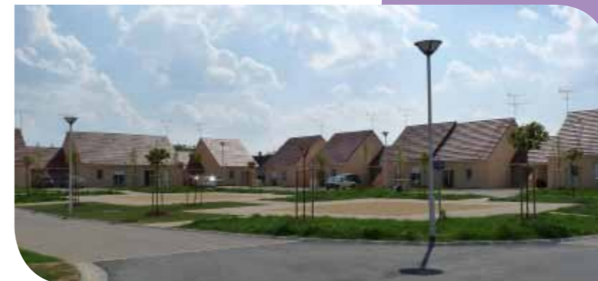
Varennes-Vauzelles La Chevalière - Construction neuve