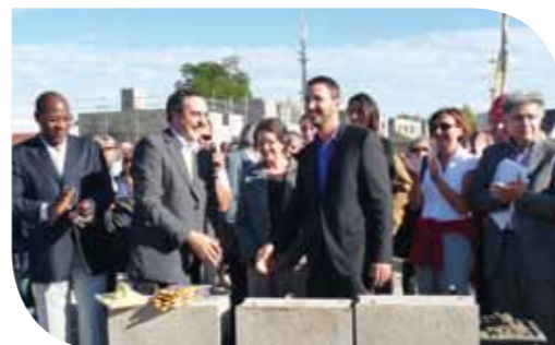
Première Pierre à l'Aiguillon - 6 octobre 2010

Au cours de l'année 2010 l'Agence de Logivie en Saône-et-Loire a relogé 14 familles labellisées « Accord Collectif » (sortie CHR/DALO/SDF/Gens du Voyage). Sur le département de la Nièvre, les procédures de relogement en logements d'insertion ont été relancées par l'Etat fin 2010.